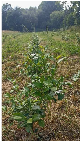
Théiers variété bretonne (Trevarez)