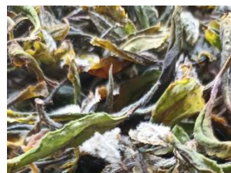
Récolte et transformation du thé