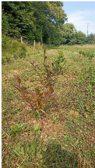
Théiers variété chinoise