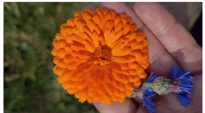
Culture de calendula et bleuet