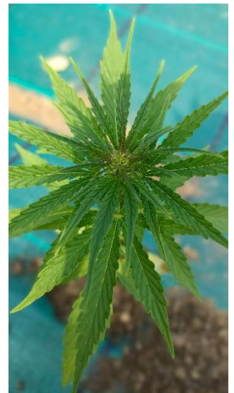
1 200 plants de CBD